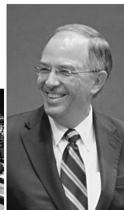
Neil L. Andersen