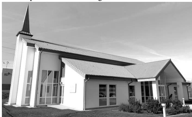
Paroisse de CHOLET, 30 rue de Saint Christophe

30 ans après la création : La grande réalisation